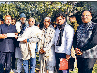
रोहतक। सिंचाई विश्राम गृह में गोशालाओं को गोवंश की सेवा के लिए वित्तीय सहायता के चेक प्रदान करते लोकसभा सांसद डॉक्टर अरविंद शर्मा।

लोकसभा सांसद डॉक्टर अरविंद शर्मा ने कहा है कि मुख्यमंत्री मनोहर लाल के नेतृत्व में प्रदेश सरकार गोधन के संरक्षण और संवर्धन के लिए कृत संकल्प है। डॉ. शर्मा सिंचाई विश्राम गृह में सरकार की योजना के तहत विभिन्न गोशालाओं को गोवंश की सेवा के लिए वित्तीय सहायता के चेक प्रदान करने के उपरंत मीडिया कर्मियों से बातचीत कर रहे थे। उन्होंने कहा कि गोशालाओं को आत्मनिर्भर बनाने के लिए सरकार और गोसेवा आयोग प्रभावी रूप से काम कर रहा है। गोसेवा ऐशा कार्य है जिसमें समाज के सहयोग की भी जरूरत होती है। इसलिए समर्थ व सक्षम लोगों को मदद के लिए आगे आना चाहिए। उन्होंने कहा कि